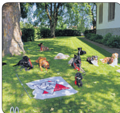
Hochzeit: Eine Gruppe Hunde und Halter an einem Hochzeit.