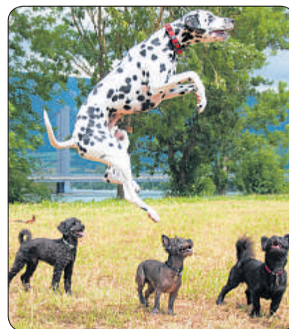
Übersprung: Amor überspringt Anour, Aramis und Niro.