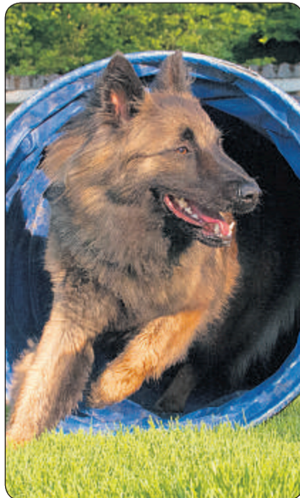
Jasko: Belgischer Schäferhund (Tervueren).