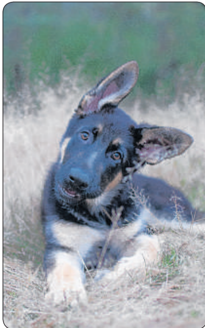
Jago: Deutscher Schäfer-Welpe, 10 Wochen alt.