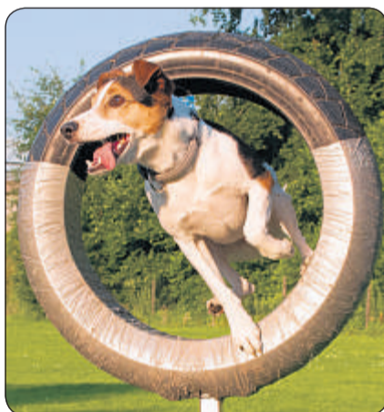
Eros: Jack Russel Terrier.